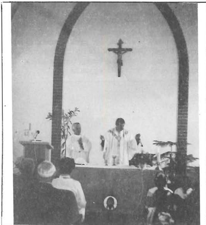
Első mise az iskola kápolnájában

Kapható a plébánián, sok más kiadvánnyal együtt. Karácsonyra értékes ajándék a könyv!