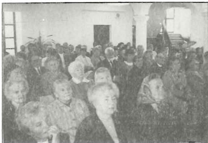
Az első mise a Katolikus Iskolában