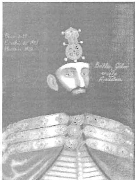
Bethlen Gábor erdélyi fejedelem (1580-1629)