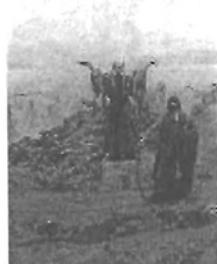
Sámán a Feszty-körképről