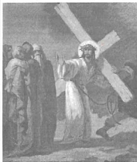
VIII. stáció - Feszty Masa festménye

A nagyböjt a keresztút járás időszaka is. Jézus szenvedései fölött elmélkedünk. Ránézünk a kálvária vagy a templom stációs képeire, máris látjuk, mit ábrázol, és kérdezzük: mit mond neked ez a kép... Mit tett Krisztus, mit teszel te? Hogyan szenvedett Ő, és te? A képek előtt elmondhatjuk az imát, majd Miatyánkot, térdet hajthatunk, énekelhetünk. Sok mai