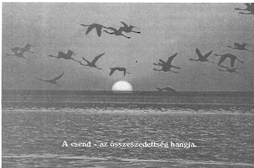
A csend - az összeszedettség hangja.