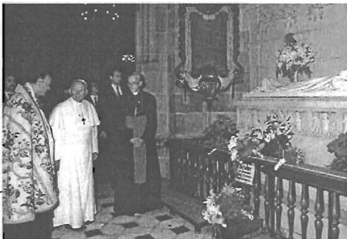
II. János Pál pápa Franciszek Macharski krakkói bíborossal a Wawelban, Szent Hedvig sírjánál. A kép az előző út során készült, 1991-ben.

II. János-Pál pápa az idei, lengyelországi útja alkalmából avatta szenté, június 8-án.