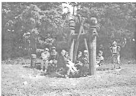
a gyulai kirándulás jól esik egy kis kipehenés

Szép színfoltja volt iskolánknak a tavasszal az iskolaújság megszületése. Gyerekek, nevelők közösen készítik.