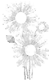
A mesét és a verseket írta: IVÁNYI MÁRIA

Jó kislány vagy! - szól a rét S rábólint a margarét: Aki minket így szeret Bizony az rossz nem lehet. - S felé int a sok kis virág: Lásd, e színes, tarka világ Mind a tiéd! Téged vár. Neked olyan szép a nyár.