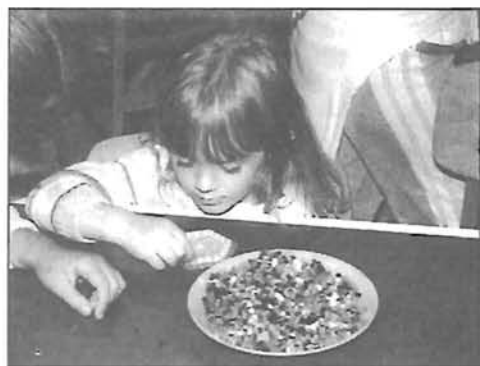
Karitász tábor Hunyán - 12. oldal