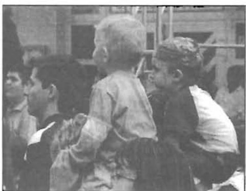
PARTNEROCK fesztivál a Bowlingon - 20. oldal