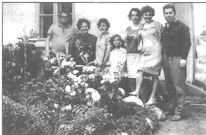
Csejt, 1972. június 5.