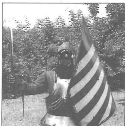
Cserkészjellegű tábor Bárnán - 16. old