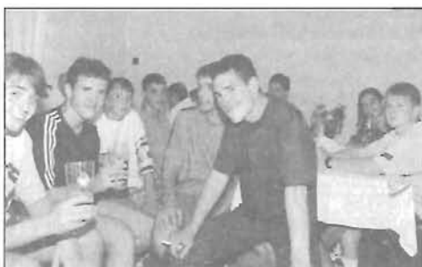
20 éve történt - a Barátság SE megalakulása II. - 12. oldal