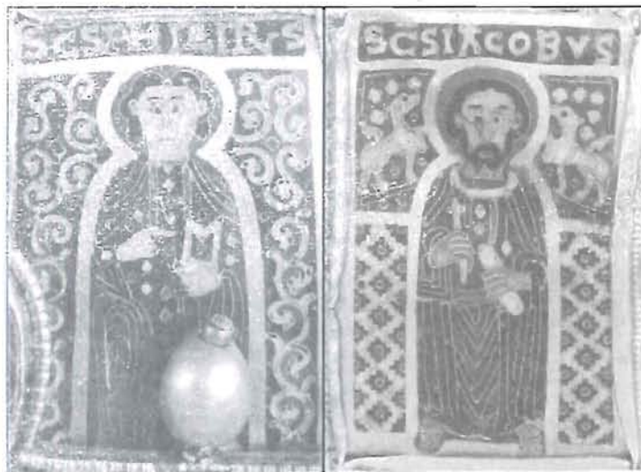
Szent Fülöp és Szent Jakab képe a Szentkoronáról

Mint a többi apostol esetében, az evangéliumok és az Apostolok Cselekedetei csak szűkösen beszélnek Fülöpről és Jakabról is. Mind a négy apostolnévsor megnevezi mindkettőjüket, Fülöpöt az ötödik, Jakabot, Alfeus fiát a kilencedik helyen.