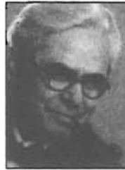
Rózsahegy Kálmán Endrőd, 1873 - Budapest, 1961

A Rózsahegy Kálmán Kistérségi Általános Iskola tanuló, dolgozó és az Endrődiek Baráti Köre Egyesület vezetősége szeretettel meghívja Önt 2011. május 13-14-15-én a