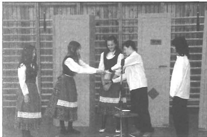
Angolul szólt a köleves meséje

A rózsahegyisek az idén is részt vettek a Kecskeméti Katona József Könyvtár, az Alternative English School és a Dél-alföldi Europe Direct Információs Hálózat által közösen megszervezett „Mesélj Európa- Tales from Europe” angol nyelvi vetélkedőn. Az előző évek nagy sikereire való tekintettel 3 csapatunk regisztrált a versenyre. Az online forduló, valamint a képregény készítés összesített eredményei alapján mind a három csapat bejutott a Békéscsabán megrendezésre kerülő elődöntőbe, ahol idén iskolánk képviselte Békés megyét.