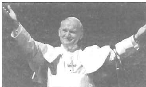
Boldog vagy, II. János Pál pápa! - 6. oldal