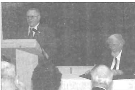
VIII. Tudományos Néprajzi Konferencia írás 10., képek - 20. oldal