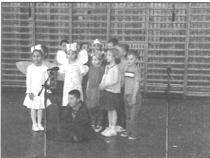
Három pillangó - az elsők előadásában

Zsúfolt nézőtér előtt versenyeztek a gyerekek: vers, zene, dal, tánc, angol és magyar nyelvű jelenet kategóriában a Ki mit tud két délutánt kitöltő programjában. A több, mint 250 lelkes szereplő mindegyike kapott jutalmat az eredményes felkészülésért.