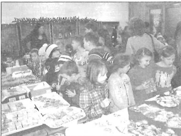
Nagy volt a választék a karácsonyi vásárrban

A decemberi hetek iskolánkban is az adventi készülődés hangulatában teltek. A karácsonyi ünnepkörrel iskolai szintű projekt keretében dolgozták fel a tanulók. A hetedik évfolyam feladata volt a programok szervezése, a feladatok kiosztása, értékelése. Minden hét közös gyertyagyújtással kezdődött, és itt kapták meg a legjobban teljesítő osztályok a finom jutalom tortákat. Volt bolhapiac is, itt használt könyvek, CD-k, játékok cseréltek gazdát.