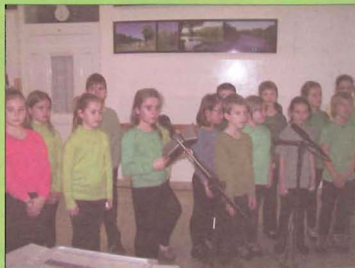
A kisdíjakok irodalmi színpada

Békés karácsonyt és boldog új esztendőt!