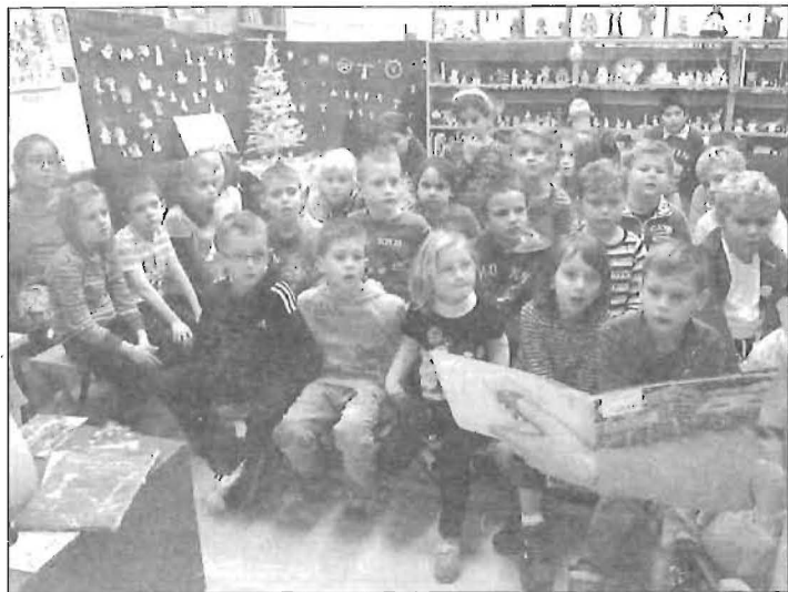
Meséltünk az angyalokról az angyalok között