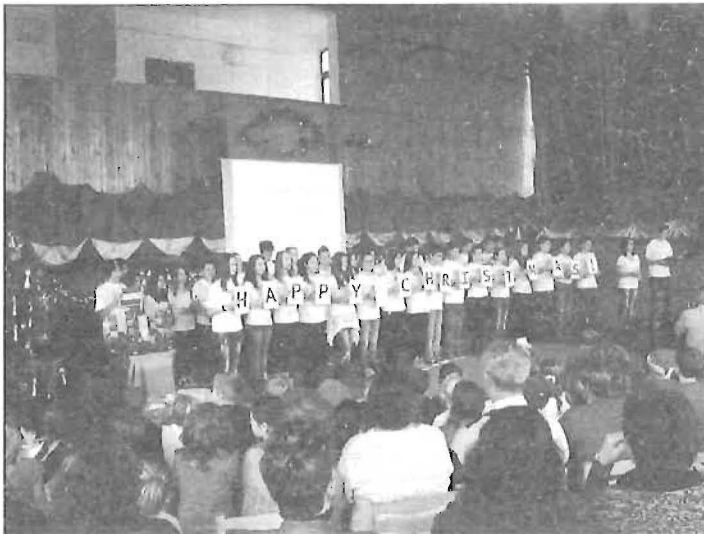
A nyolcadikosok záró képe