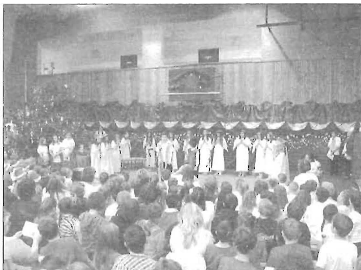
A betlehemes játékot a hatodikosok adták elő