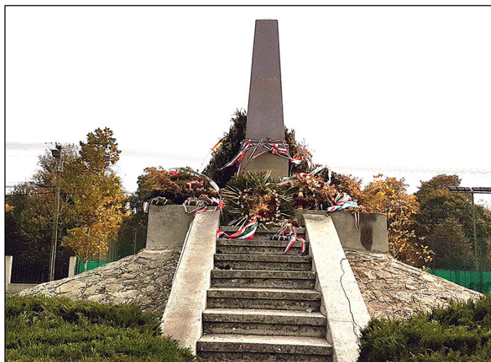
Aradi vértanúk emlékműve Aradon

Aulich Lajos, Damjanich János, Desseffy Arisztid, Knezić Károly, Lahner György, Lázár Vilmos, Leiningen-Westerburg Károly, Lenkey János, Nagysándor József, Poeltenberg Ernő, Schweidel József és Török Ignác perének ítéletét 1849. szeptember 26-án hozták meg.[14] Velük együtt ítélték tíz év várfogságra Gáspár András tábornokot, aki azonban később kegyelmet kapott, és magas kort ért meg.[15] Gáspár később így emlékezett az ítélethirdetésre: „ Olyan büszkén fogadták a halálos ítéletet, mintha csupa dicséretet olvastak volna fel előttük. A kihallgatásoknál, amikor még remélték, hogy javítanak sorsukon, talán szelídeknek mutatkoznak, de most: mindegyik egyszerre úgy megkeményedett, mint a gránitszikla. ”