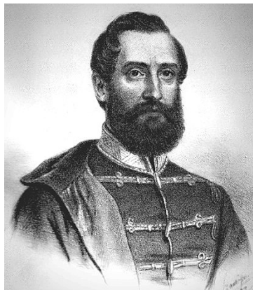
Lázár Vilmos honvéd ezredes (1815–1849) örmény nemzetiségű

„Ki tehet arról, hogy ilyen a magyar sorsa? Krisztus keresztje tövében érett apostollá az apostolok lelke és bitófák tövében kell forradalmárrá érni a magyar lelkeknek.”