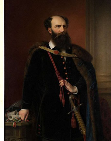
Gróf németújvári Batthyány Lajos Ferenc József

„Isten adta a szívet, lelket nekem, amely népem és hazám szolgálatáért lángolt.”