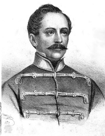
Török Ignác honvéd tábornok (1795–1849) magyar nemzetiségű

„A mai világ a sátán világa, ahol a becsületért bitó, az árulásért hatalom jár. Csak egy igazi forradalom, a világ új forradalmi embersége söpörheti el ezt az átkozott, meghasonlott világot.”