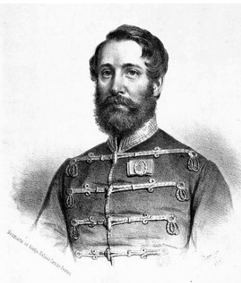
Leiningen-Westerburg Károly gróf, honvéd tábornok (1819–1849) német nemzetiségű „A világ feleszmél majd, ha látja a hóhérok munkáját.”

„Ki tehet arról, hogy ilyen a magyar sorsa? Krisztus keresztje tövében érett apostollá az apostolok lelke és bitófák tövében kell forradalmárrá érni a magyar lelkeknek.”