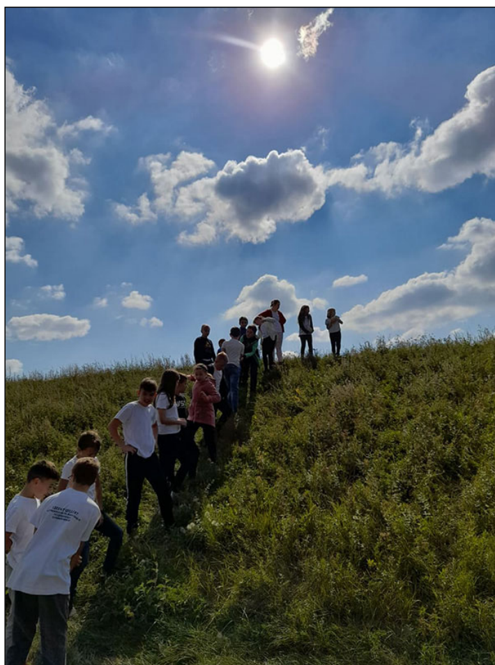
A Hármas-Körös árterében