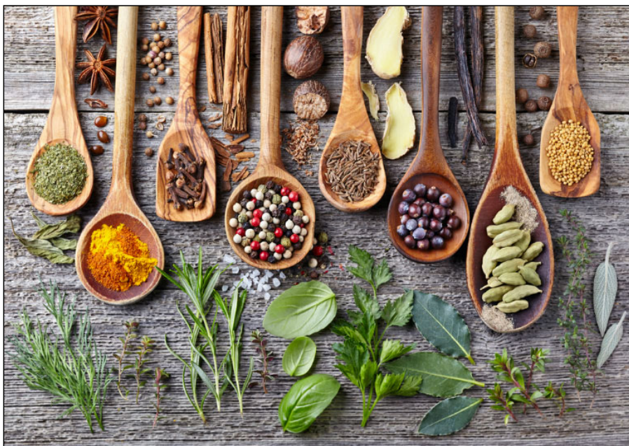
Babér és más fűszernövények

A babérlevél készítmények váladékkoldó, köhögéscsillapító, immunrendszer erősítő, gyulladáscsökkentő és lázcsillapító hatásúak, ezért alkalmazhatók nátha, influenza kezelésében, hörghurut és asztma gyógyításában. Olajos kivonata külsőleg, bedörzsölőként alkalmazható ízületi gyulladás kialakulásakor. A babérlevél készítmények vírus-, baktérium-és gombaellenes hatásúak, Candida albicans okozta fertőzések kezelésében is hatékonyak. A babérlevél oldat a szájüreg fertőtlenítésére és a