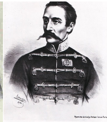
Poeltenberg Ernő lovag, honvéd tábornok (1808–1849) osztrák nemzetiségű

„De rettenetes volna most az elmúlásra gondolni, ha semmit sem tettem volna az életemben. Alázatosan borulok Istenem elé, hogy hőssé, igaz emberré, jó katonává tett.”