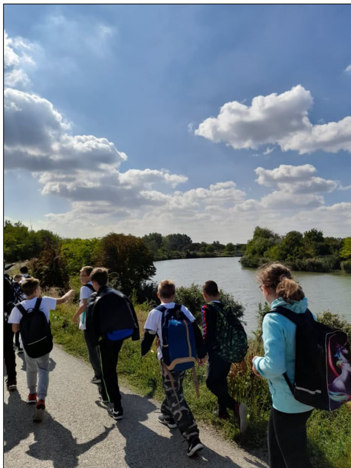
A Hármas-Körös árterében