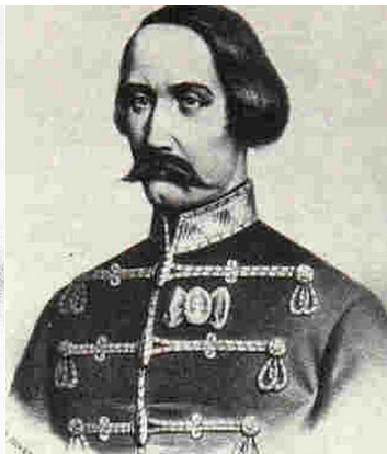
Nagysándor József honvéd tábornok (1803–1849) magyar nemzetiségű

„A világ feleszmél majd, ha látja a hóhérok munkáját.”