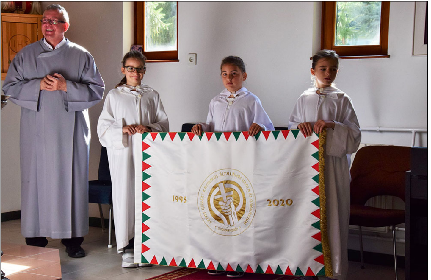
Laci atya ajándéka