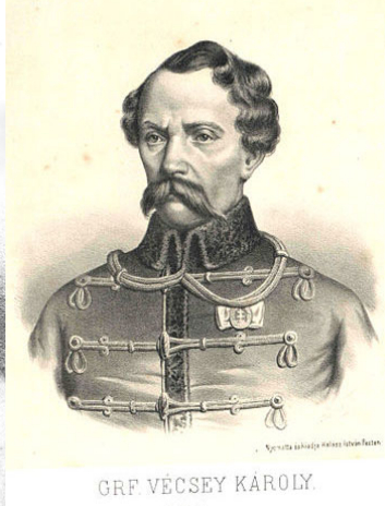
GRF VÉCSEY KÁROLY gróf, honvéd tábornok (1803–1849) magyar nemzetiségű

„Nemsokára Isten legmagasabb ítélőszéke elé állok. Életem parányi súly csupán, de tudom, hogy mindig csak Őt szolgáltam.”