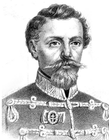
Schweidel József honvéd tábornok (1796–1849) német nemzetiségű

„Minket az ellenség dühös bosszúja juttatott ide.”