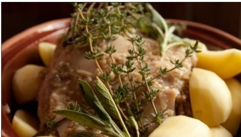
Csombor. fűszer a konyhában