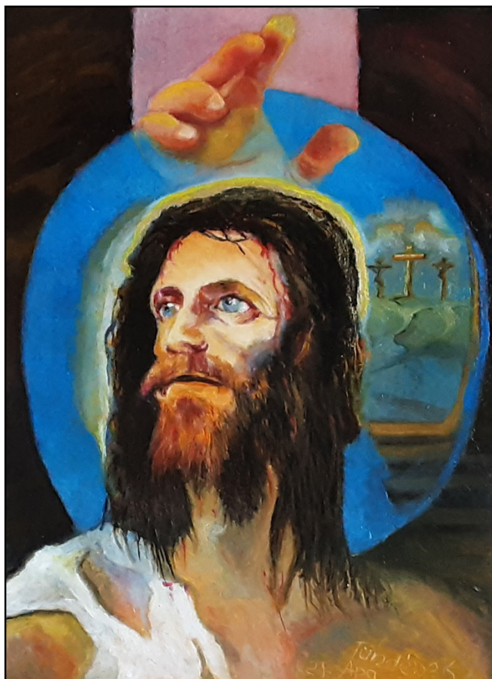
dr. Frankó Károly alkotása

Húsvét tiszta áldozatát a hívek áldva áldják. Bárány megváltja nyáját, és az ártatlan Krisztus már kiengeszteli értünk Atyját. Élet itt a halállal megvitt csodacsatával, a holt Életvezér ma Úr és él!