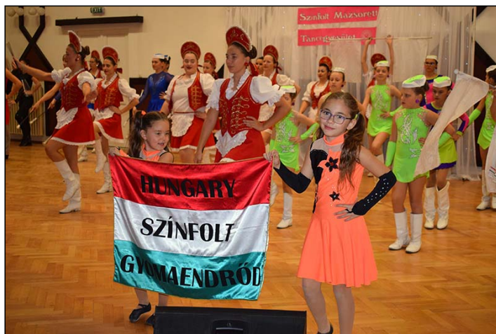
Bevonulás, kicsik és nagyok együtt