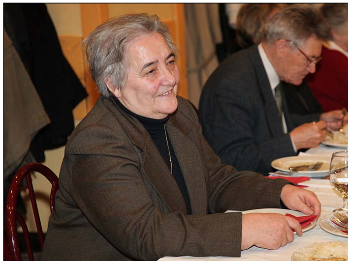
Endrődiek Baráti Körének találkozásán, 2010. március 6-án

Temetése október 16-án, a 10 órakor lelki üdvéért tartott gyászmise után volt az endrődi köztemetőben, katolikus szertartás szerint.