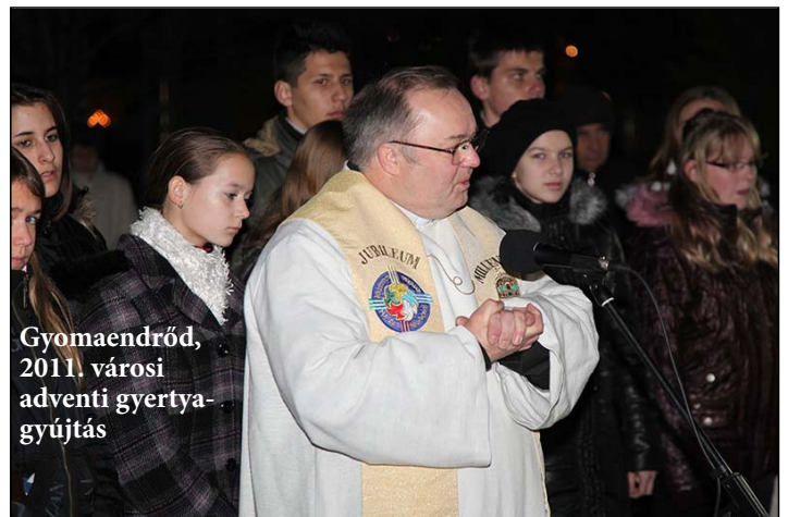
Gyomaendrőd, 2011. városi adventi gyertyagyújtás