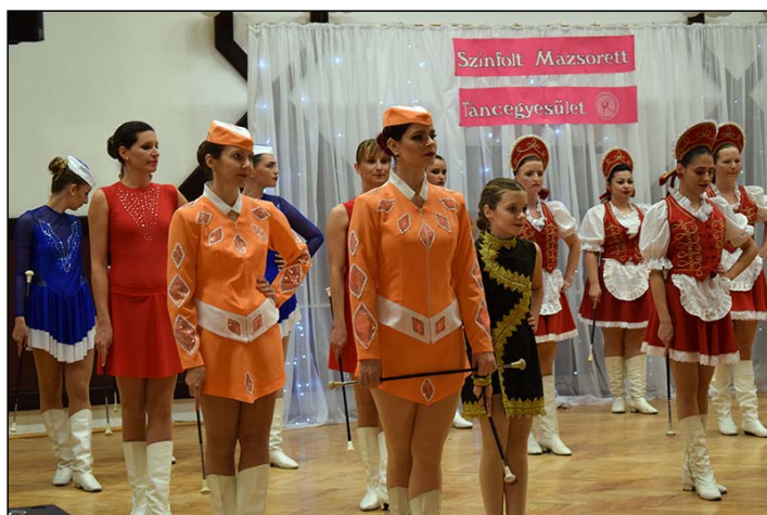
Kicsik és nagyok együtt