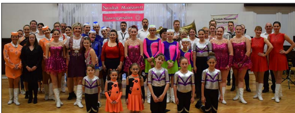
Csoportkép a gálaműsor végén