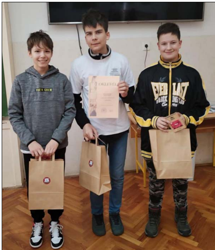
Pályaaorientációs nap és a 2024 „KisBálintos” Csillaga díj átadója