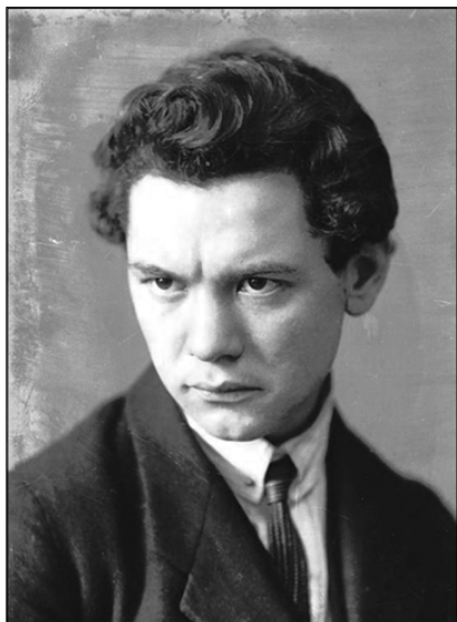
József Attila - Homonnai Nándor felvétele, 1924 körül

120 éve született József Attila, 1905. április 11-én. Költeményeiből olvashatnak most, melyeket a Verses öröknaptár című - több kiadást megélt - kötetből válogattam.