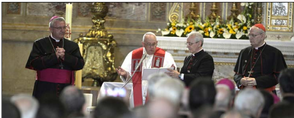
Ferenc pápa a Budapesti Szent István-bazilikában