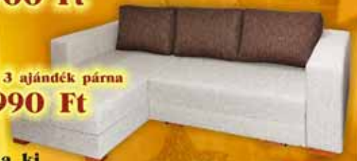
Tibi sarok + 3 ajándék párna