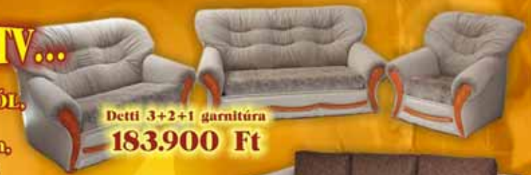
Detti 3+2+1 garnitúra