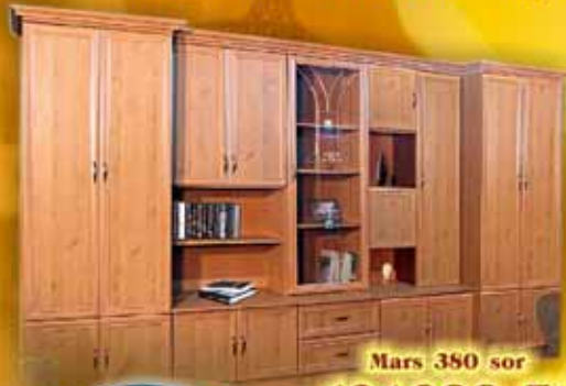
Mars 380 sor