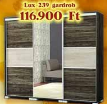
Lux 239 gardrob