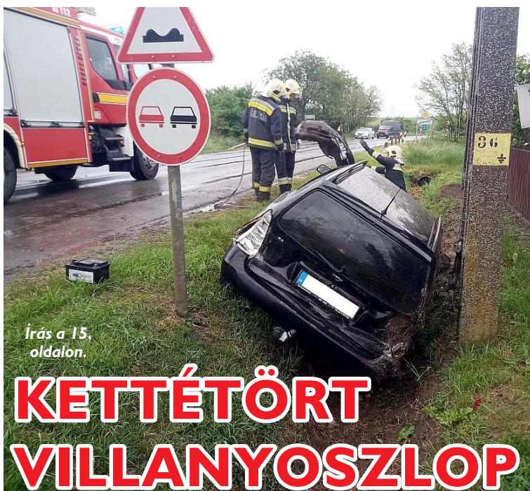
Írás a 15. oldalon.