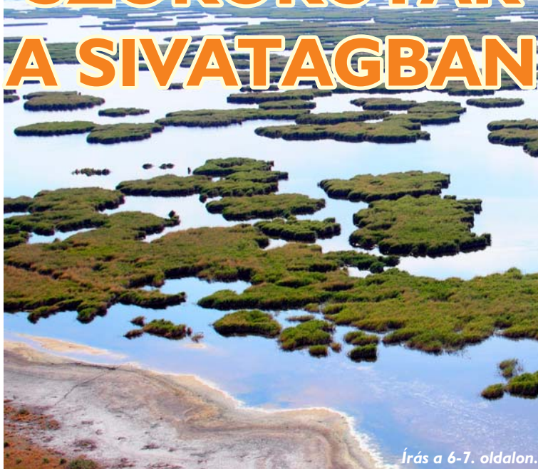
Írás a 6-7. oldalon.