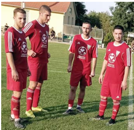
Előkészítők és befejezők