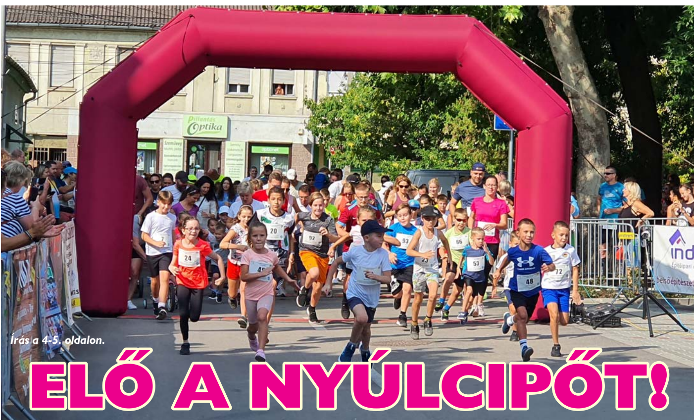
Írás a 4-5. oldalon.