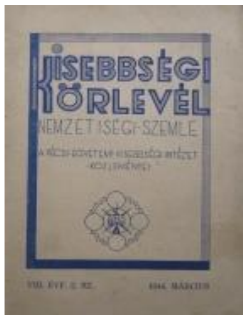
2. kép: A kisebbségi magyar irodalmi Láthatár (1933 – 1944) és a Pécsi Egyetemi Kisebbségi Intézet közleményeit tartalmazó Kisebbségi Körlevél (1942)