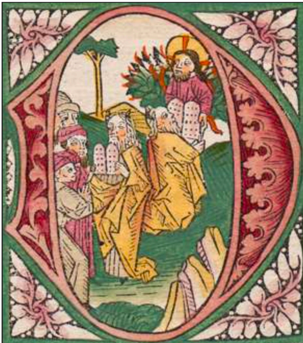
Abbildung 2: Deutsche Bibel. Gedruckt von Günter Zainer , Augsburg ca. 1475/76, fol. 69v: Moses erhält die Gesetzestafeln und verkündet die Gebote an das Volk (Bayerische Staatsbibliothek München 2 Inc.s.a. 194-1).

Grundlage des für den Übertritt in das Jenseits bestimmenden irdischen Wohlverhaltens sind die Zehn Gebote, die Gott an Moses überreicht, von dem sie dann weiter an die Rechtsunterworfenen verkündet werden (Abbildung 2).