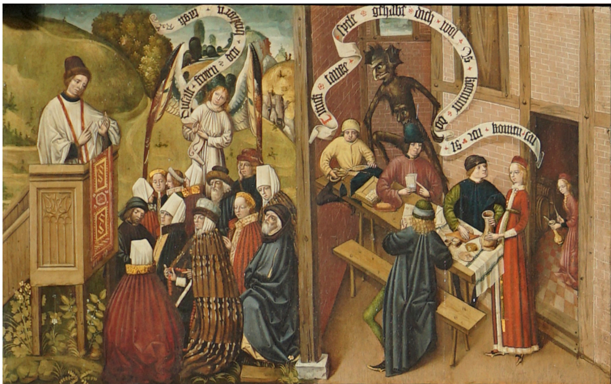
Abbildung 4: 3. Gebot. Marienkirche Danzig (Gdansk), unbekannter Künstler, Ende 15. Jahrhundert 5

man solle den Tag des Herrn heiligen. An Stelle des Besuches der hl. Messe arbeitet der Schneider, spielt man Karten und isst und trinkt, alles wieder schuldhaft kategorisiert durch den Teufel im Hintergrund.