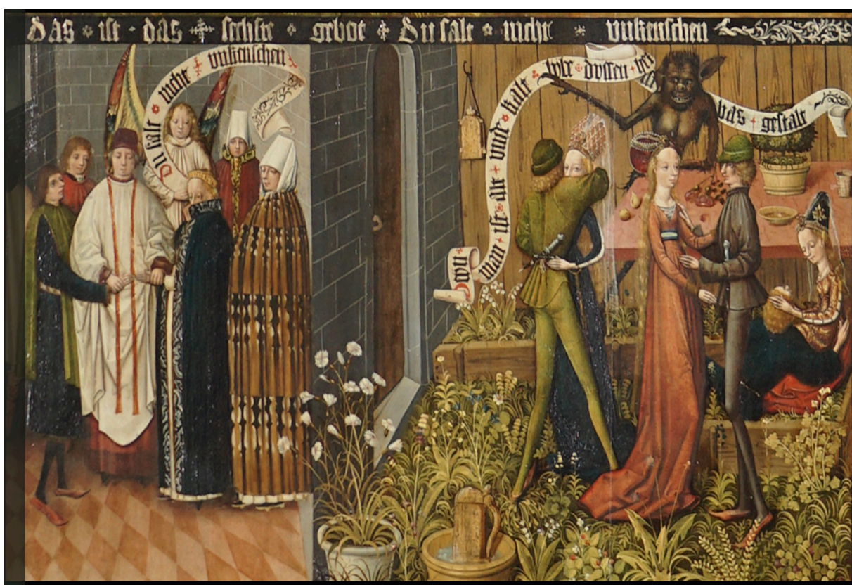
Abbildung 3: 6. Gebot. Marienkirche Danzig (Gdansk), unbekannter Künstler, Ende 15. Jahrhundert 4

Das erste Exempel (Abbildung 3) zum sechsten Gebot über die Unkeuschheit zeigt den einzig zulässigen Weg zur Sexualität, die Eheschließung. Der mit Schuld beladene Weg ist hingegen im rechten Bildteil deutlich gemacht, sowohl was die Handlungen betrifft als auch deren Schuldhaftigkeit durch den auf das Spruchband weisenden Teufel.