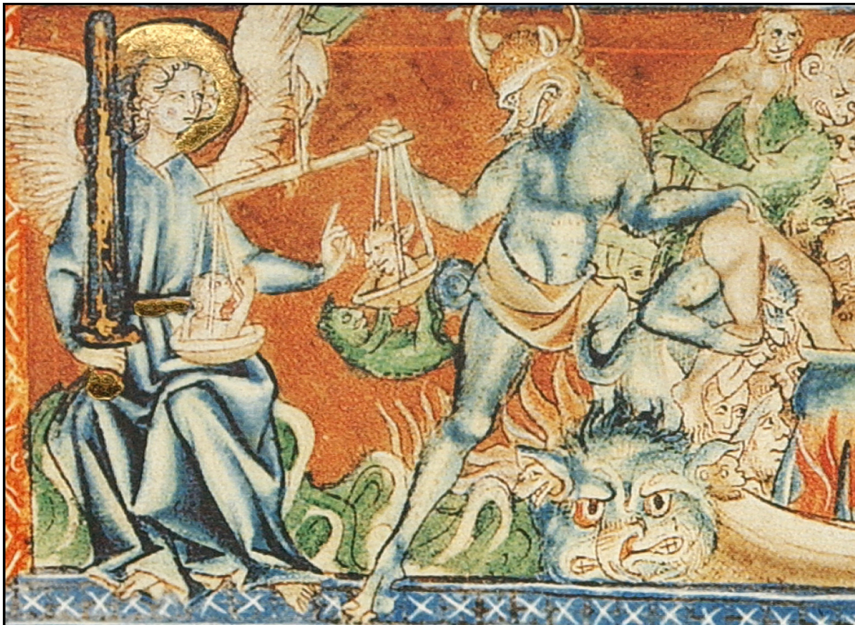
Abbildung 6: Weltgericht mit Seelenwaage. Apocalipsis Gulbenkian, fol. 073v, England 1265–1270. Museu Calouste Gulbenkian, Lissabon MS. L.A. 139

Eine andere Möglichkeit wäre die Bewertung mit Hilfe der hier im Bildbeispiel von der Hand Gottes gehaltenen Seelenwaage 7 (Abbildung 6), die sich im Spannungsfeld zwischen dem Erzengel Michael und dem Teufel befindet; manchmal kombiniert man auch Sündenregister und Waage. Im konkreten Fall bleibt die Seele trotz der Bemühungen der teuflischen Seite (ein Teufel sitzt in der Waagschale und zwei andere versuchen zusätzlich vergeblich Druck auszuüben) im Unschuldstatus, die Waage senkt sich zu ihren Gunsten, es gilt also nicht: “Gewogen und zu leicht befunden“ (Daniel 5:27). Im Grunde genommen ist dies eine frühe Form der Beweiswürdigung zur Ermittlung von Schuld und Unschuld.