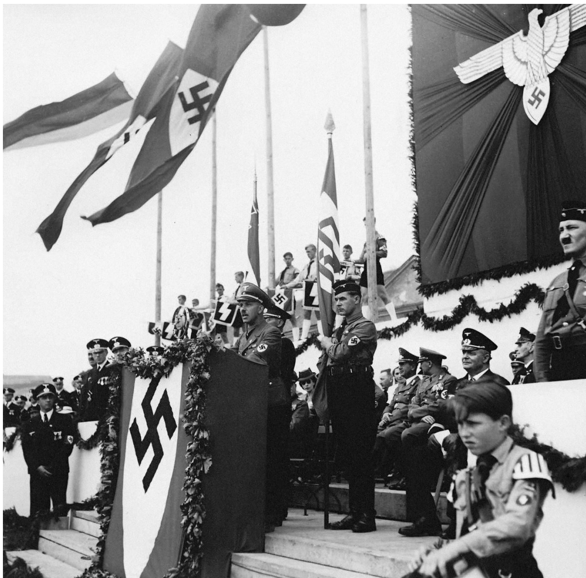
1. ábra: Franz Karmasin szlovák-német népcsoportvezető ( Volksgruppenführer ) a szlovákiai Német Párt ( Deutsche Partei ) által szervezett rendezvényen, a Frontkatonák Napján ( Tag der Frontsoldaten ) 1940-ben.

kormányban a német népcsoportért felelős államtitkárként szolgált. 62 A személyi állomány, az ideológia és a szimbolika (1. ábra) tekintetében tehát elmondható, hogy az új népcsoportjog által messzemenő hasonulás ment végbe a „III. Birodalommal”. 63