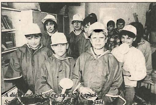
A diákrendező új egyenruhákat kapnak Szarvasi Bűnmegelőzési Bizottságtól

A verseny megrendezése során a támogatást felajánlók névsorát közlétezzük.