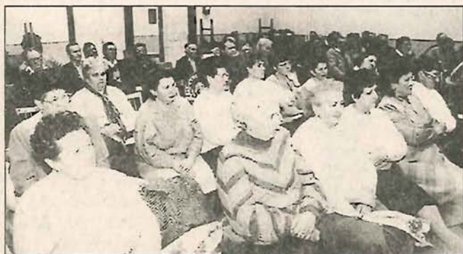
Az Endrői Gazdakör nőnapj gyűlésén