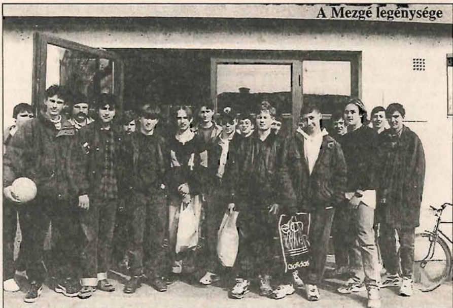
A Mezgé legénysége