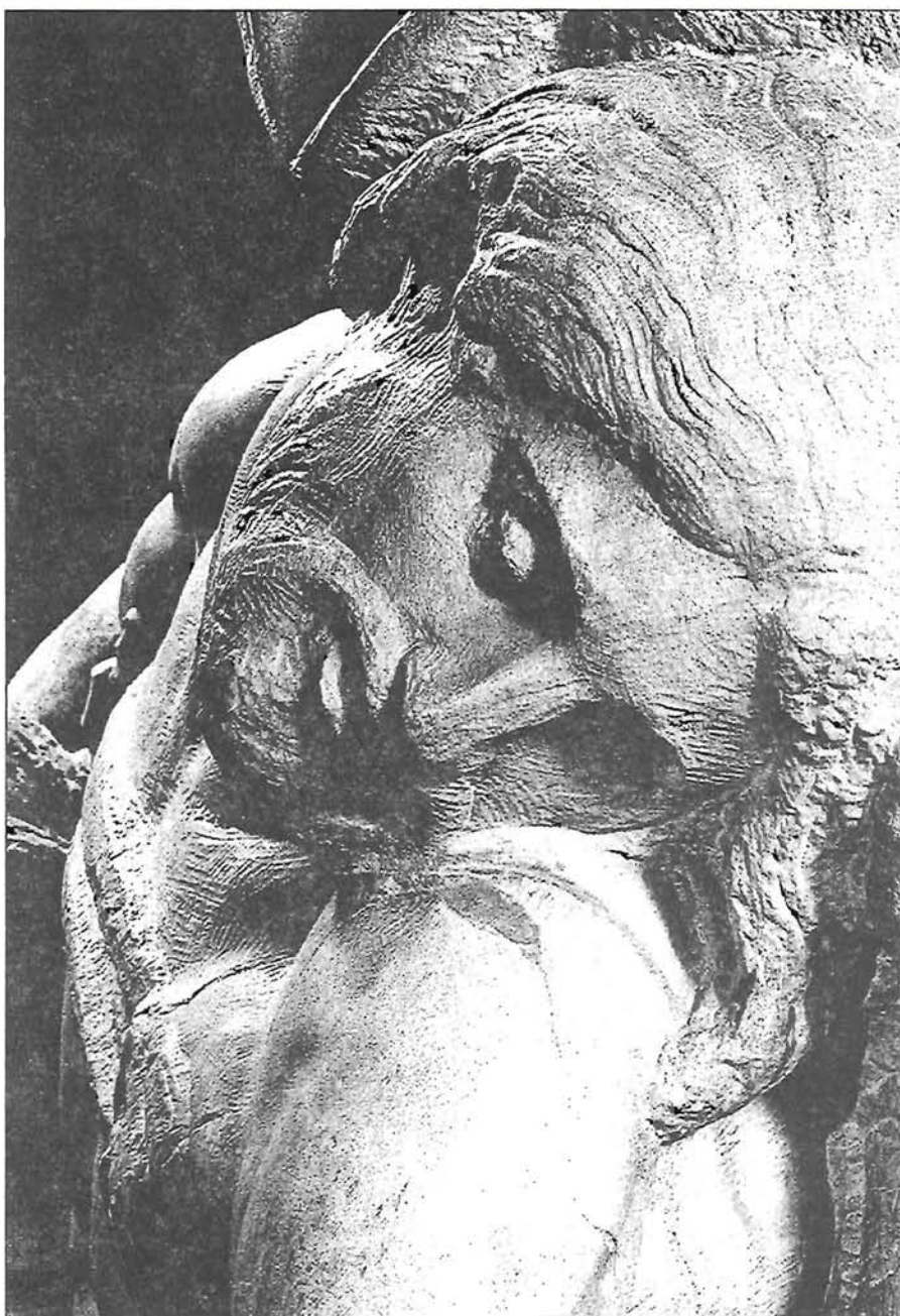
Michelangelo: Pietà, részlet