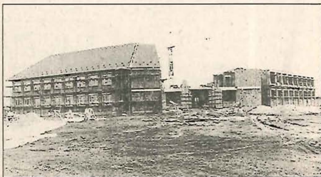
A cseperedő egyházi iskola épülete