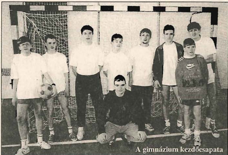
A gimnázium kezdőcsapata