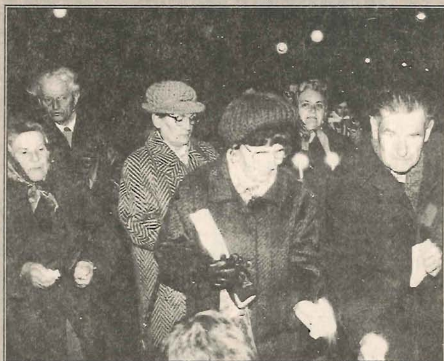
Az endrői sortűz áldozatainak megemlékezése