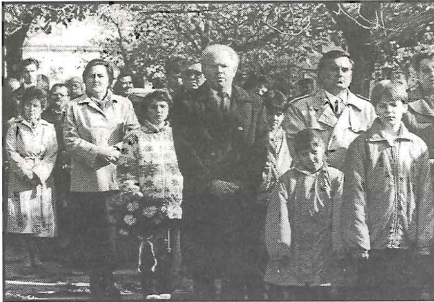
Az október 23-i ünnepség endrői koszorúása