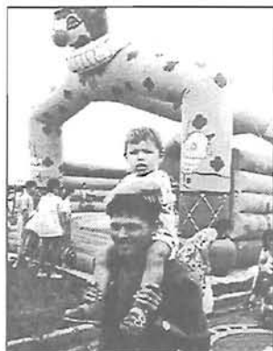
„Majdnem olyan nagy vagyok...”

A Katona József Művelődési Központ rendezésében mássodszorra zajlott le az augusztus 20-i ünnepség és a kísérő programok sora a város geológiai közepén, az ipari és a katolikus iskolák, valamint az Október 6.-ltp. között 19-én. Dél előtt 10 órától kezdve jóval éjfél után fejeződött be a egész napos, sok embert vonzó esemény.