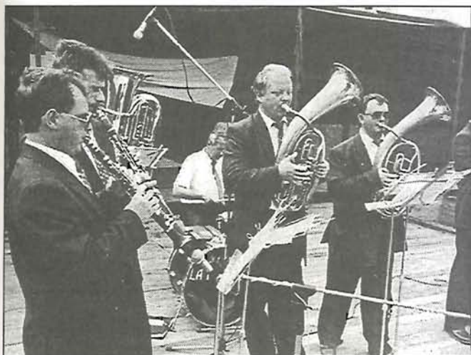
Kellemes szözene külhomból