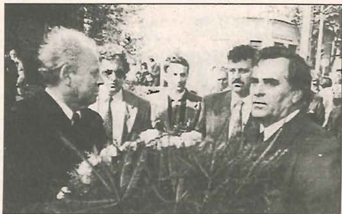
A gyomai koszorúzás háttérében a nagyenyedi küldöttség

sorral idézték fel a tragikus eseményeket, ezután koszorúkat helyeztek el a kopjafánál a város lakói.