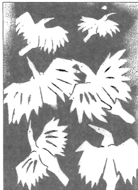
Diószegi Ágnes 10. a