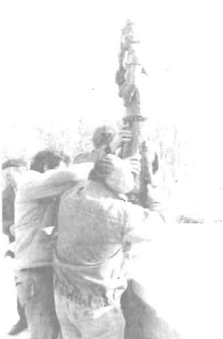
A védőszent elhelyezése