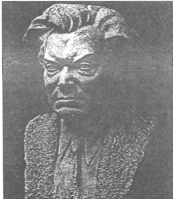
Kisfaludi Strobl Zsigmond: Pásztor János