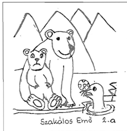
Szakálos Ernő 2. a.