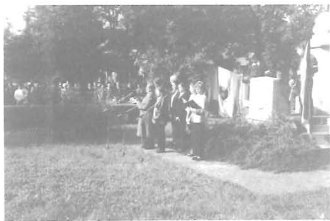
Az október 23-i forradalomra, mártírjaira emlékező programokból – gyomai részen

A rendőrség értesíti a lassújármű tulajdonosokat, hogy a jármű átrendszámozása december 31-ig terjedő időszakig végezhető el. Akik még nem tették ezt meg, mihamarabb intézzék el a szükséges teendőket. Van lehetőség a rendőrségen az ügyfélfogadási időn túli intézkedésre is, előzetes bejelentés alapján.