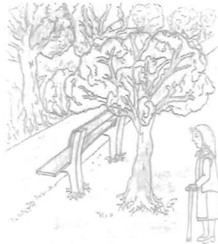
Kazár Éva: Ősz

Megjött a fagy, sikolt a ház falán, a holtak foga koccan. Hallani. S zizegnek fönny a száraz, barna fán vadmirtuszok kis ősz bozontjai. Egy kuvik jóslatát hullatja rám; félek? Nem is félek talán.