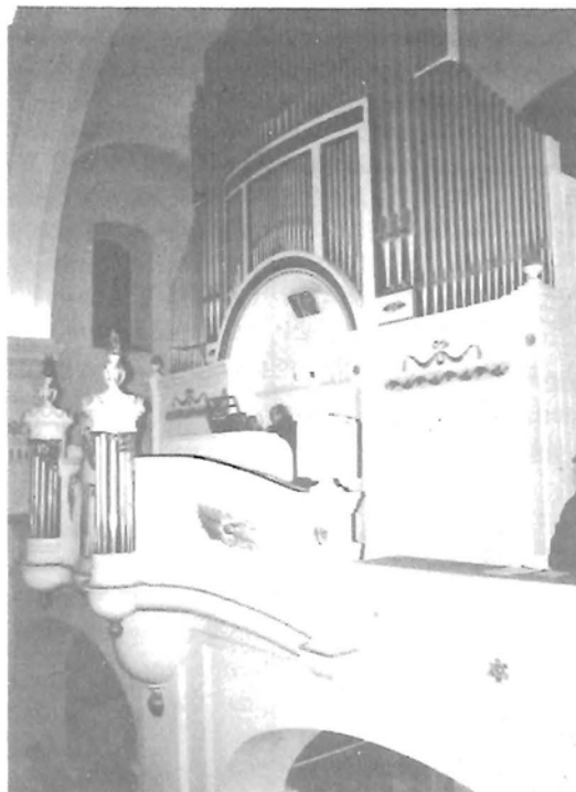
A református templom orgonája