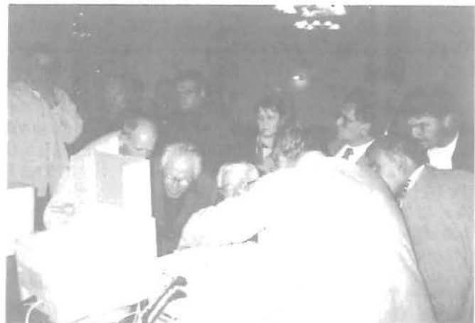
A választási eredményre várva a városháza nagytermében.

A művek október 22-ig voltak megtekinthetők.