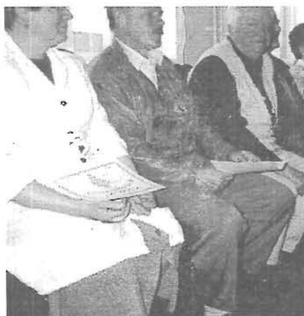
A díjazottak egy csoportja

A kolbászversenyen 13 versenymű került elbírálásra.