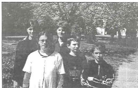
A legvidámabb csapat... országos versenyen a 2. Sz. Általános Iskola (12. old.)