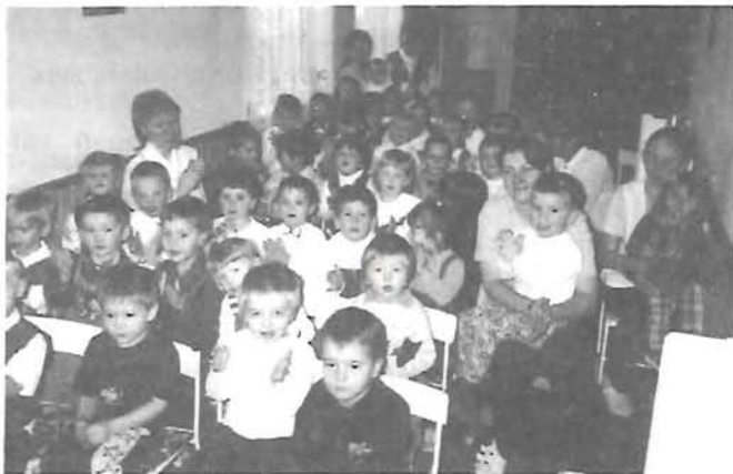
Türelmesen várták a Mikulást

és karácsonyi ünnepek a Kossuth utcai óvodában