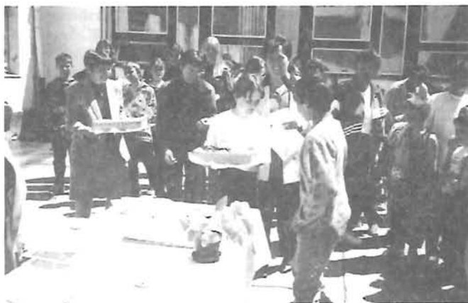
Rózsahegy nap '99. június A tortát megnyerték, had egyék...