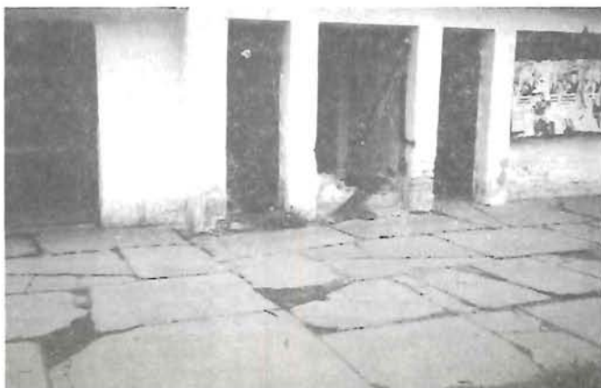
Turista váróban a régi piactéren, avagy a csendélet az új évszázadra is megmarad?...