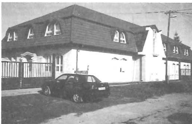
A Lakatos – Dosszié Nyomda utcai képe '99. dec.