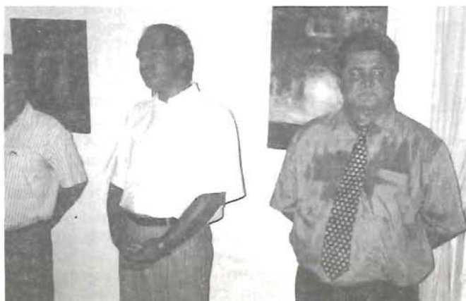
Gubucz igazgató úr meleg pillanatai a művészeti tábor kiállításán '99. aug. 17.