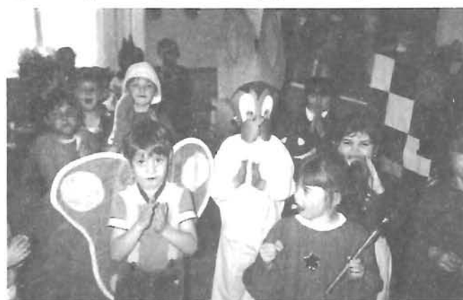
Farsang az óvodában