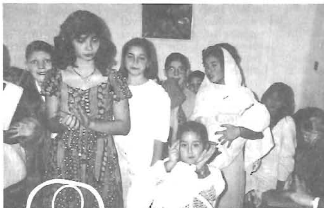
A CKÖ rendezvényein oklevelet osztottak és Kisebbségi Napot ünnepeltek 7-8. oldal