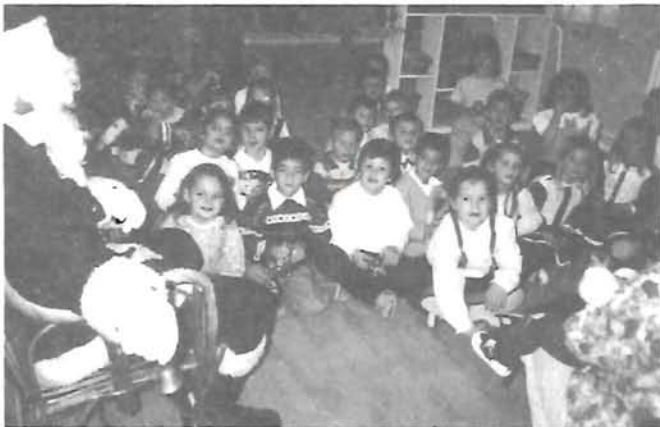
Télapó a Kossuth utcai oviban