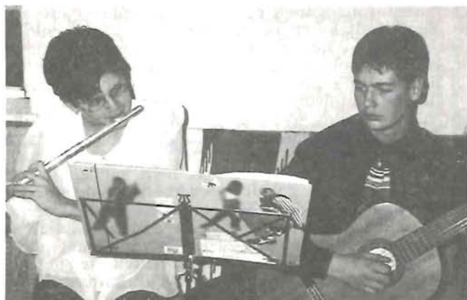
A Zeneiskola új helyre került 3. oldal