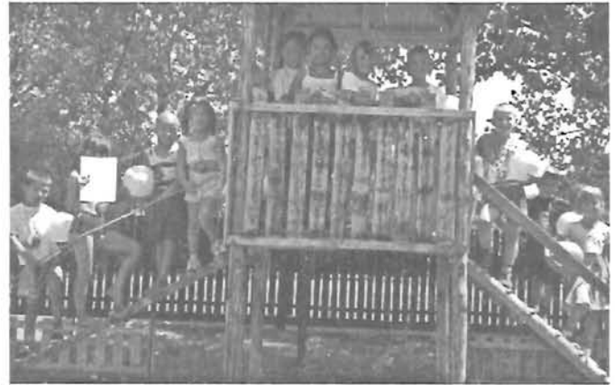
Az oviolimpia helyezettjei 13., 15., 20. old.

Gyomaendrőd, Szabadság tér 1. • Polgármesteri Hivatal