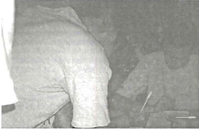
Állásbörze fiataloknak a Munkaügyi Központban. Jelentkezés a nyári diákmunkára (7. oldal)

XIX. ÉVFOLYAM 7-8. SZÁM • 2000. JÚLIUS-AUGUSZTUS • MEGJELENIK HAVONTA • ÁRA 70 FT