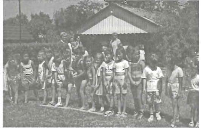
Oviolimpián, a futók egy csoportja a rajtnál