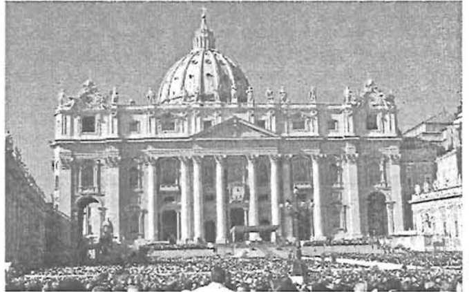
Vatikán, Szent Péter Székesegyház

A Szent Péter tér méltó nyitánya a dóm és a palota nagyszerű együttesének. Ez a világ legszebb tere. A tér alkotója Róma egyik legnagyobb építőművésze – Bernini. Az ő híres kolonádjai mintegy magukhoz ölelik a látogatók tömegét. A tér középpontjában hatalmas, Egyiptomból hozott obeliszk áll. A Szent Péter bazilika a kereszténység legnagyobb temploma. Annak a fényes ökeresztény bazilikának a helyén áll, melyet Constantinus császár építtett 324-ben a szent apostol hagyomány szerinti sírja felé. Ez