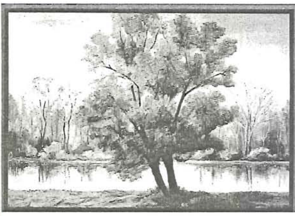
Bíró (i) Lona kiállításán 16. oldal