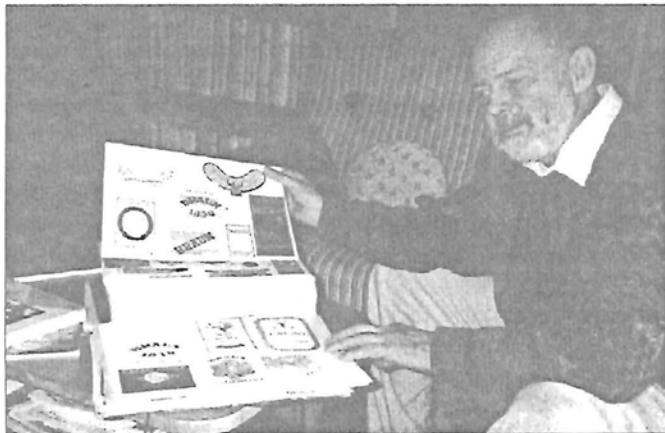
Az egyik dosszié tartalma

Gyűjtőszenvedélyére, amit édesapjától örökölt, már jelentősebb sajtóorgánumok is figyeltek úgy itthon, mint külföldön. Egyik legnépszerűbb ezek közül a Zwack-féle Cocktail magazin, de televízióban is szerepelt már