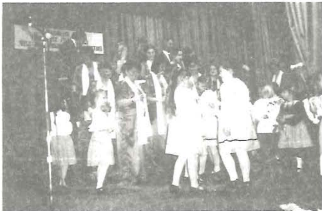
Ovigaléria megnyitón az előadók egy csoportja 8. oldal

XX. ÉVFOLYAM 3. SZÁM • 2001. MÁRCIUS • MEGJELENIK HAVONTA • ÁRA 77 Ft