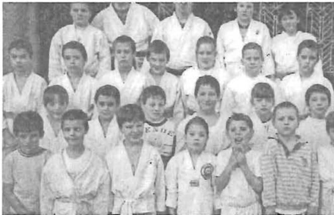
A Gyomaendrődi Judo Klub versenyzői

Régi problémát oldottunk meg az idén az edzők cseréjével. A judo klub vezető