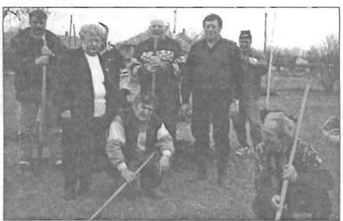
Diszják a XXI. század tiszteletére 8. oldal