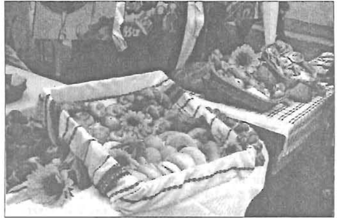
A Bethlen Iskola sütőiparosainak termékei

Nyitva: Hétfőtől Péntekig 9–15 óráig Közületeknek háztól házig szállítás!