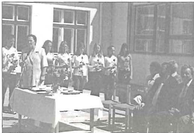
Az ünnepség egy pillanata

Az iskolai versenyeken Rózsahegy Kálmán életéről az 5-6. osztály korcsoportban a 6/a, 7-8. osztályos korcsoportban a 7/a bizonyult a legjobbnak, míg az alsósok akadályversenyét a Gézengúz csapat nyerte.