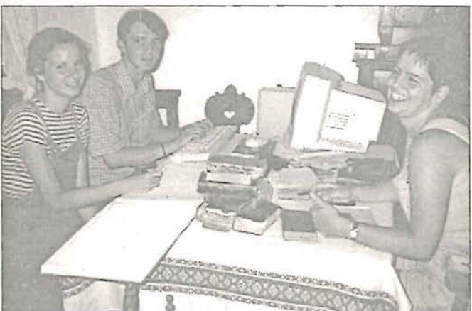
Készül a tájházi lettár – 4. oldal