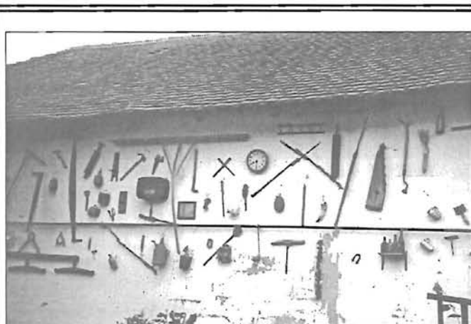
Régi óra, citera, rádió és sok egyéb...

A nap eseménysorát környezetvédelmi fórum zárta a Városháza nagyteremben.