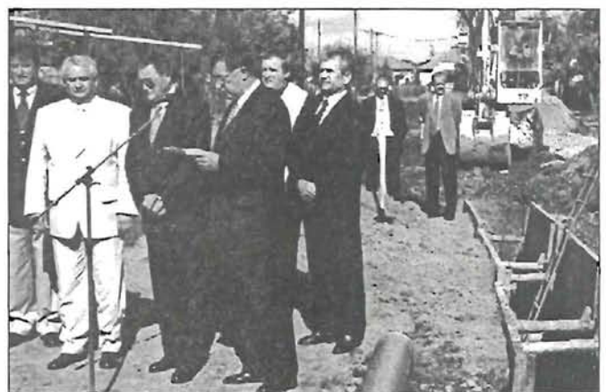
A szennyvízépítési beruházás ünnepélyes elindítási aktusa elérkezett. Ezen jelen volt a környezetvédelmi miniszter, Túri-Kovács Béla, továbbá Latorcai János is. Képes, szöveges beszámoló a 3. oldalon