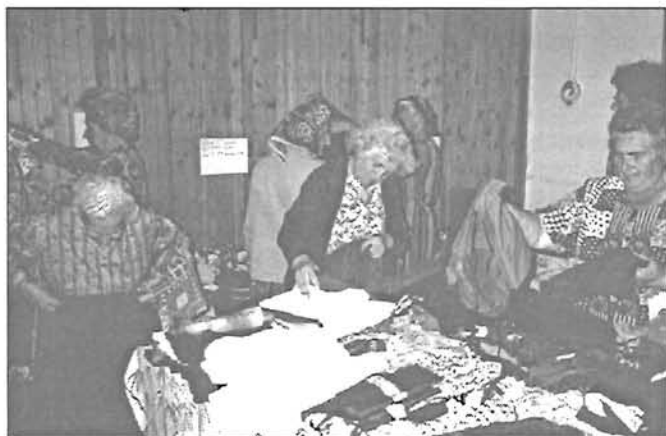
Ruhaosztáson az öregszerzői ÖNO-ban

Az öregszerzői Gondozási Központban ruhaosztást tartottak. A Gondozási Központ dolgozói és az elhalt gondozottak hozzátartozói ruhagyűjtésének eredménye egy csomó használható ruhanemű, amit nagy örömmel fogadtak, és válogattak belőle a településrész rászorulóit. Mint elmondták sokat segít egy-egy ilyen lehetőség, ahol blúzokat, szoknyákat, nadrágokat és egyebeket kínálnak számukra, mert egyesek koruk miatt sem mozdulnak ki Öregszerzőből, vagy esetleg pénztárcájuk sem mindig engedi meg a ruhavásárlást. Legtöbbjük talált a maga vagy családja számára egy-egy darabot. Köszönetet mondanak mindazoknak, akik ezt előteremtették számukra.