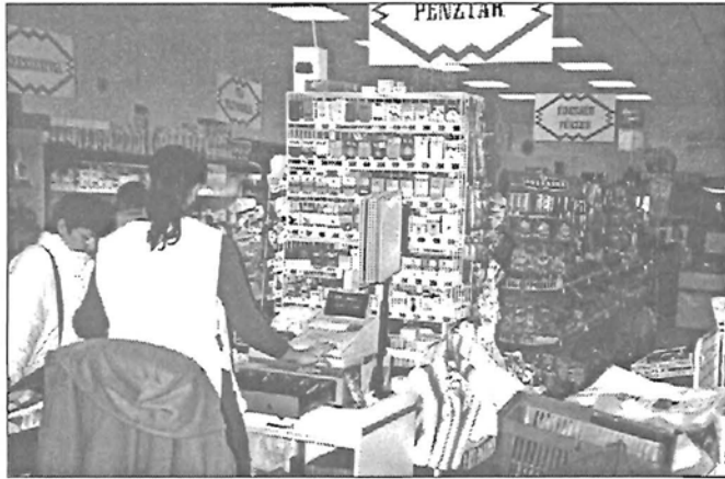
A 2. számú üzletben

Kívánjuk a Sikér Kft. további korosodását, amennyiben ez a gyomaendrődiek megelégedésére szolgál!