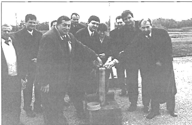
Az alapkö elhelyezése

Az előkészületek mintegy négy éve húzódtak, most végre elindulhat a beruházás. Értéke alapjaiban mintegy 480 millió, illetve a jelenleg folyó