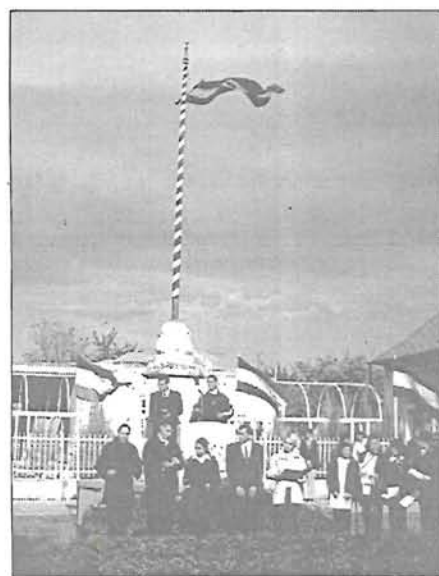
A Bethlen iskola műsora a gyomai oldalon