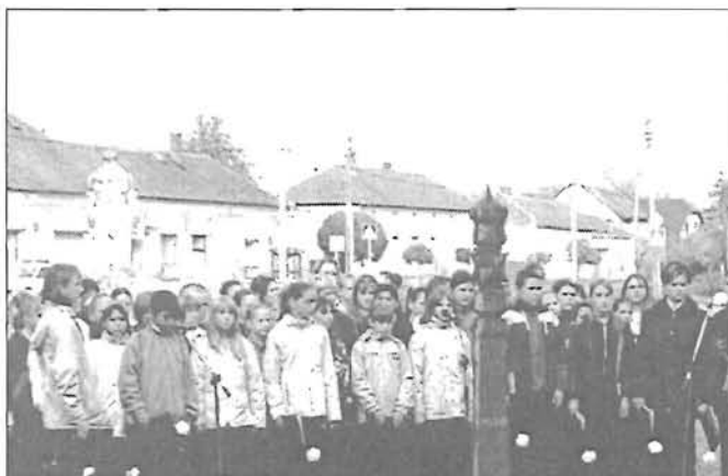
A Rózsahegy-i iskola diákjainak programja Endrődön