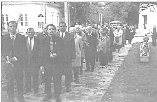
Koszorúzásra várnak Gyomán