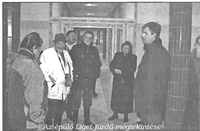
Az épülő Liget-fürdő megtekintése