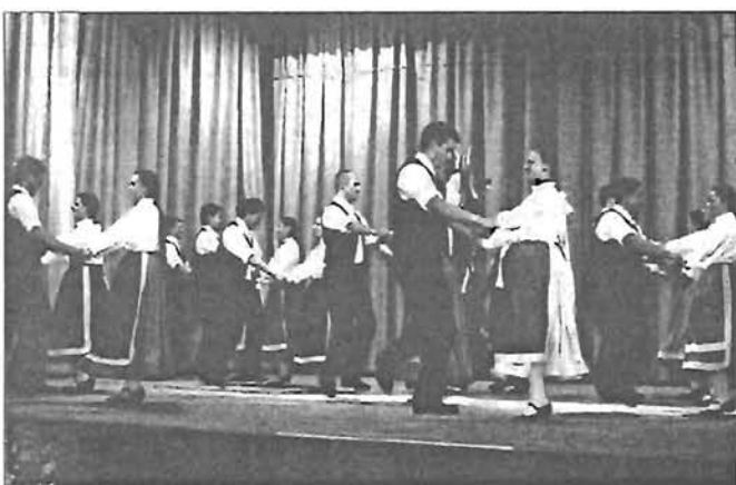
A Kőrösmenti Táncegyüttes sikerei a 9. oldalon

XXII. ÉVFOLYAM 11. SZÁM • 2003. NOVEMBER • MEGJELENIK HAVONTA • ÁRA 109 FT