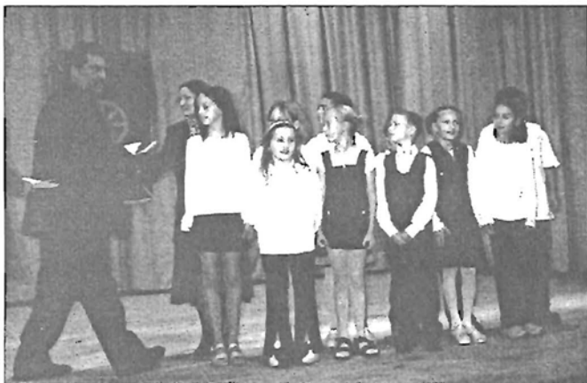
A Rózsahelyi iskola tanulójának műsora