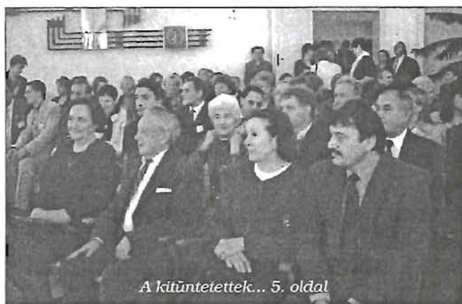
A Kötöttetettek... 5. oldal