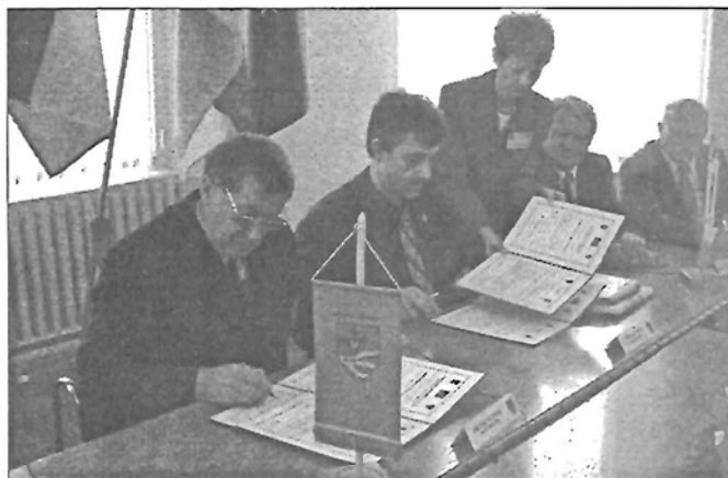
A testvérvárosi megállapodás aláírása

Schöneck, Németország egyik koncentrált gazdasági régiójában fekszik, Frankfurt közelében. Úgy gondolom, hogy az EU-csatlakozás után már biztosan nem lehet akadály semmilyen téren – erre nézve sem.