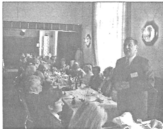
Pohárköszöntő a „Hollerban”

Elvira varroda Gyomaendrőd, Kossuth u. 18. alatt