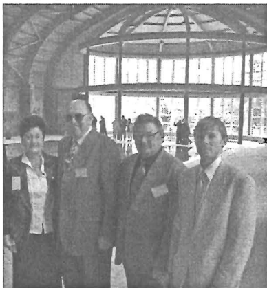
Az új uszodában