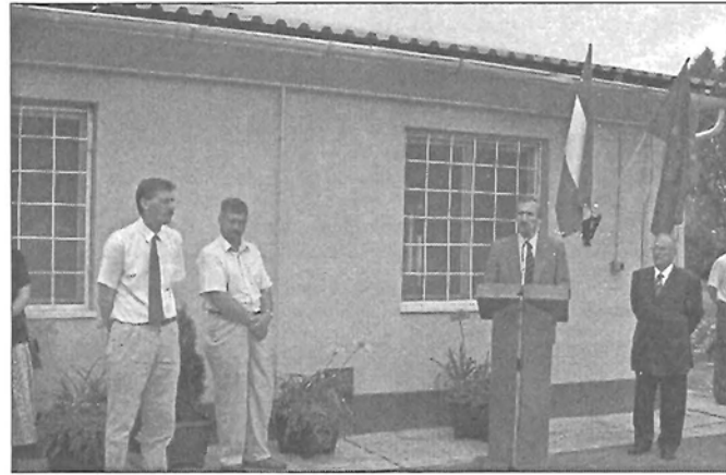
Németh Imre miniszter beszéde

Németh Imre agrárminiszter átadó beszédében hangoztatta, hogy a magyar agráriumban, vidéken, megindult az „élet”, van innovációs készség. Reményteljes, hogy a mezőgazdaság technikai megújítására, a feldolgozás fejlesztésére a vidéki, mezőgazdasági infrastruktúra fejlesztésére és a falu arculatának, kulturális értékeinek megőrzésére tudjuk fordítani az EU-s támogatásokat – mondta. A Nemzeti Fejlesztési Terv öt operatív prog-