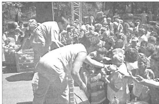
A megszentelt kiscipók szétosztása