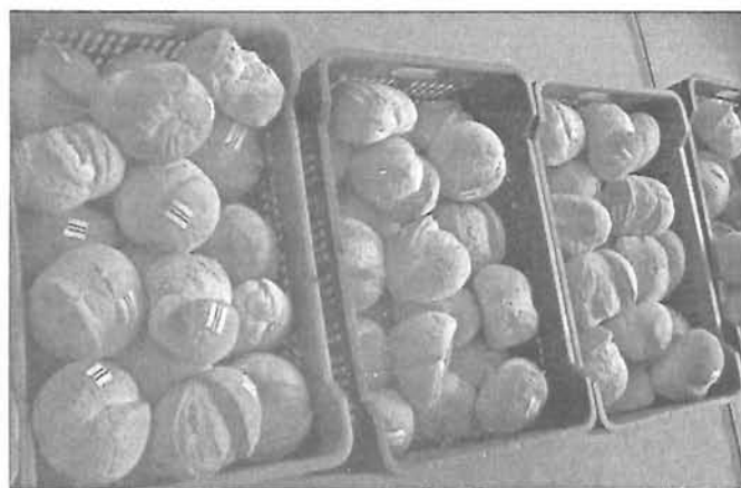
A kiosztásra váró kiscipők