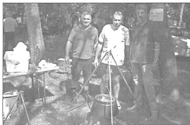
A Szeged Fish Kft. csapata