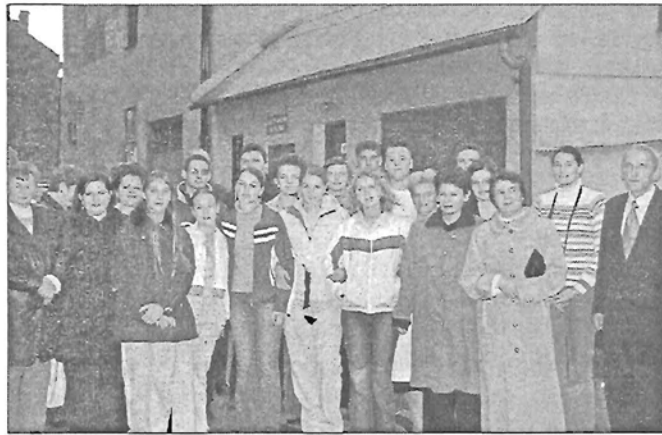
Búcsú a vendéglátó családotól

Megerősödött a közös igény, hogy hosszabb távú barátságot, kapcsolatot építsünk ki, ami nagyszerű alkalmakat kínál az angol nyelv gyakorlására, egymás kultúrájának megismerésére is.