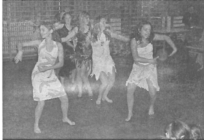
A nyolcadikos lányok produkciója

A 7. b osztály egy októberi napon meglátogatta Gyomaendrőd új létesítményét, a nemrég átadott hulladékkezelőt.