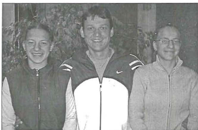
A Rózsashegyi Iskola sporteredményei az 5. oldalon