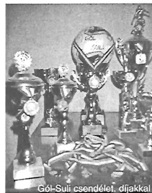
Gól-Suli csendélet. díjakkal

A labdarúgópallántak az idén is edzőtáborozáson vettek részt július közepén Ásotthalmon, ahol mini-focitornára is sor került, jól szolgálva az őszi idényre való felkészülést.