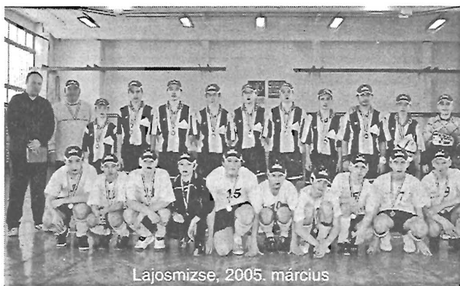
Lajosmizse, 2005. március