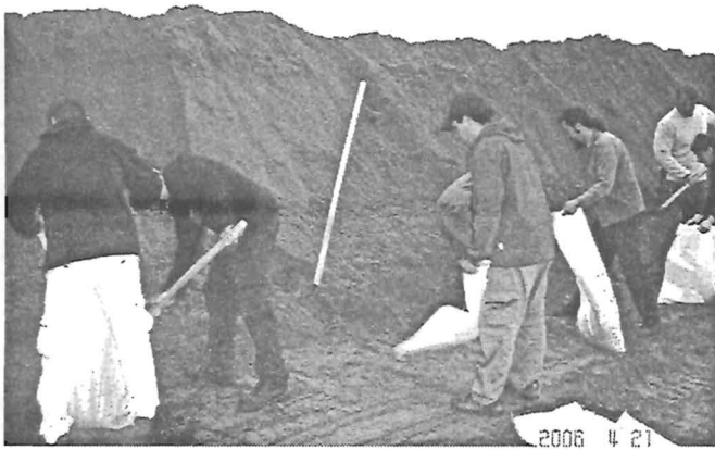
Önkéntesek a gáton

sait, azokat a munkákat vették számba, amelyeket a vízügyi szakemberek számukra meghatároztak. Több, mint 700 katonára 102 technikai eszközzel van itt (április 24-én). Váltott, 12 órás műszakokban dolgoztak, magasították a gátat, vagy építették a töltést támogató bordákat, szigetelték a szivárgásokat.