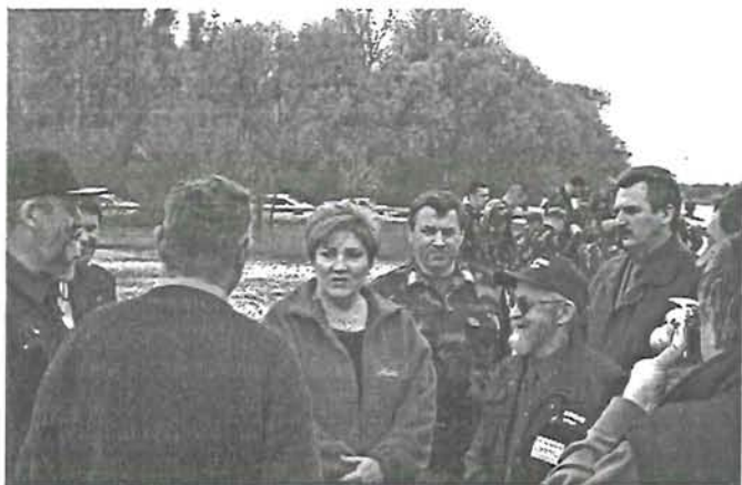
Lampert Mónika belügyminiszter a Hármaskörös gátján