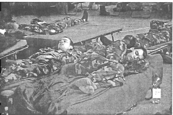
Pihennek a katonák a Sportcsarnokban

víz tudatától, miután azt megpillantotta, megfájdult a szíve, s a katonák megérkezése tudatosította, hogy nagy baj lehet. Készített már vagy száz szendvicset számukra, és ásványvizet is adott a katonáknak. Megnyugvást jelent, hogy apad a víz, és a katonák ott vannak, ahol szükség van rájuk.