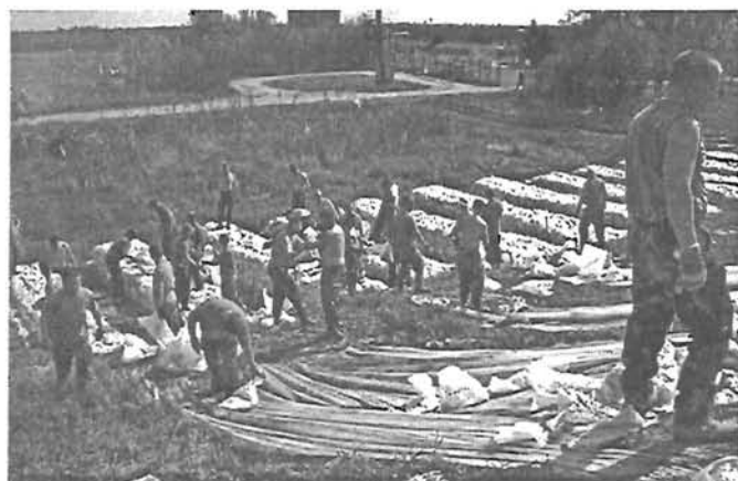
Emberfeletti védekezést igényelt a történelmi magasságú Körös vize!