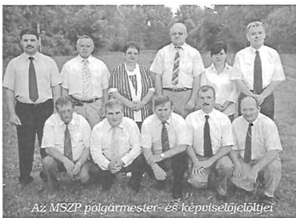
Az MSZP polgármester- és képviselőjelöltjei

Magyar Szocialista Párt Városi Szervezete