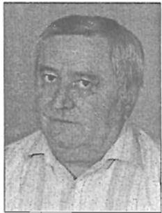
JAKUS IMRE KÖRÖSÖK VIDÉKÉRT EGYESÜLET

forintos aranykoronánkénti áron igyekeztem juttatni számukra a földet. Úgy érzem, megtettem a földet igénylőkért azt, amit lehetett. Ebben a szellemben politizálok ma is, igyekszem a közösség javára lenni. Az évek során tapasztalatokat szereztem az életben és a munkában egyaránt, és hála Istennek, mindmáig fizikai és szellemi erőm sem hagyott el. Van még elég rászoruló, akikért a jövőben is kiállok. Azért vállaltam el a FIDESZ, a KDNP, s a gazdakörök jelölését, hogy képviselőként még többet tehessek értük. Bízom a győzelemben, hogy Gyomaendrőd fejlődhet. Ha Várfi András lesz a polgármester, biztos vagyok benne, hogy jól tudunk majd együttműködni. A lakosságnak nem mindegy, hogyan képviselik az érdekeit.