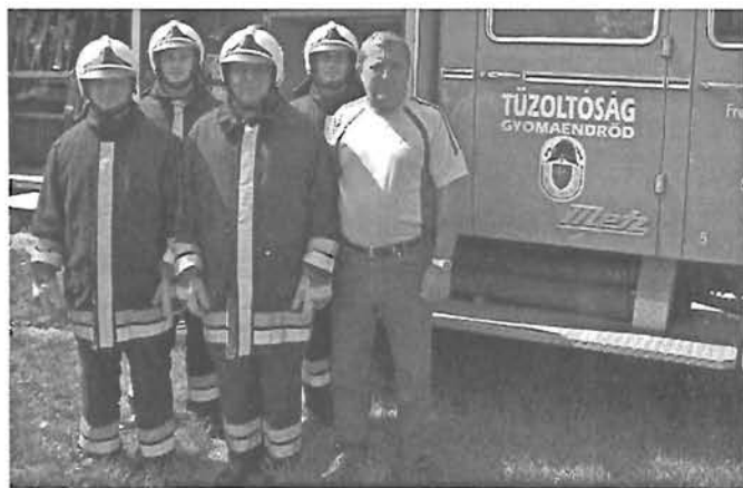
Az Önkéntes Tűzoltó Egyesület néhány tagja (cikk a 7. old.)

Irodánk címe: 5650 Mezőberény, Fortuna tér 5. (Spar-áruház mögött)