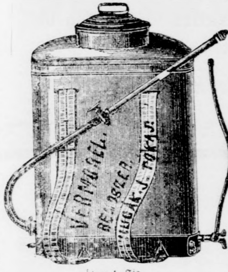
Ábra 1. 58

rendszerü permetező gépeit, egy évi jótállás mellett, darabját 17 forint 50 krajczárért.