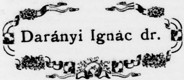
Darányi Ignác dr.

Hirdetések és pénzküldemények a kiadóhivatalhoz intézendők.